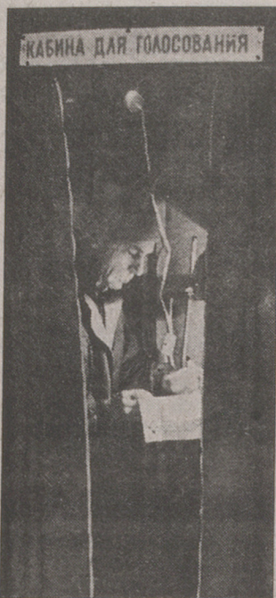
КАБИНА ДЛЯ ГОЛОСОВАНИЯ

Последние в этом году выборы в Гатчине состоялись!